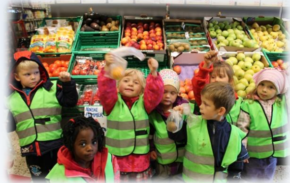
På butikken og handler vår egen frukt og betaler med penger selv!