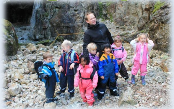
Jungeldyr ved gruva I Evje.

Ellers så har vi fått nye barn og det gleder vi oss over, og ser at de nye finner seg fort til rette i gruppa.